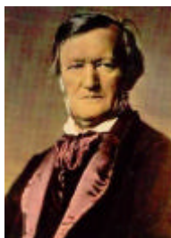
En kunstner og hans mæcen. Udvalgte slides fra foredraget findes på www.richardwagner.dk