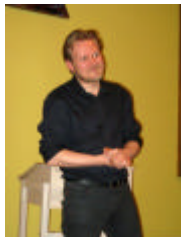
Foredragsholder Kasper Holten

Torsdag, den 11. marts 2010 fornøjede operachef Kasper Holten de fremmødte medlemmer og gæster med sin gennemgang og uddybning af og mening med sin nylige iscenesættelse af Tannhäuser. Det blev spændende timer med megen information krydret med god spørgelyst blandt publikum.