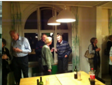
Die Feen droftes i pausen