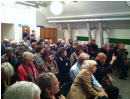
Publikum lytter intenst

Aftenens anden afdeling drejede sig om operaen Das Liebesverbot fra 1836. Her var der tale om en slags komedie delvist inspireret af stilen i Rossinis og andres operaer. Temaer som Kærlighedsforbudsloven givet af statholderen i Palermo genfindes i forskelligt udtryk hos tidligere